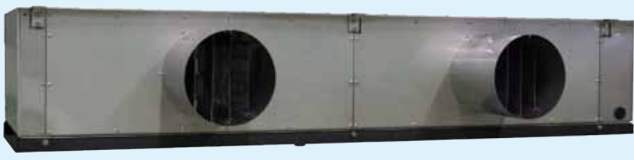
■騒音値：50Hz（当社測定による）